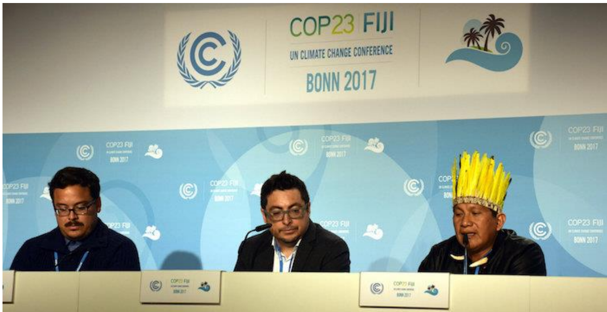
Leaders from Indigenous communities speak at a press conference in COP 23.