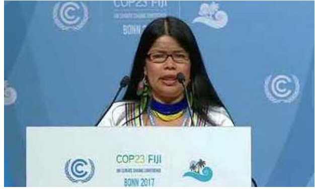
Patricia Gualinga at COP23

하는것이 아니고 해결책을 갖고있습니다. 『살리는 산림』이라고 불리는원주민들의 토지에서 지속가능한 개발을 달성하는 로드맵을 제안하고있습니다. 그러나(COP 와같은 회의에서) 그것에 관한 소개를 할 수 있는 기회가 필요한 것입니다.」