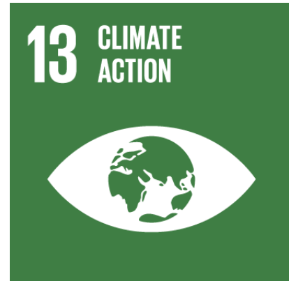
資料 : SDGs Goal No. 13

.칼바르호씨는 피지와 같이 원주민 문제를 중심으로 밀어붙이기에는 이의가 있다 하며 「이것은COP의장국의 피지에 있어서 중요한 문제이고 WWF는 이러한 성과를 환영하고 보다 많은 나라별 약속에 이것들이 반영이 된다면 좋겠다고 생각한다.」라고 말하였다(11.20.2017) INPS Japan/ IDN-InDepth News