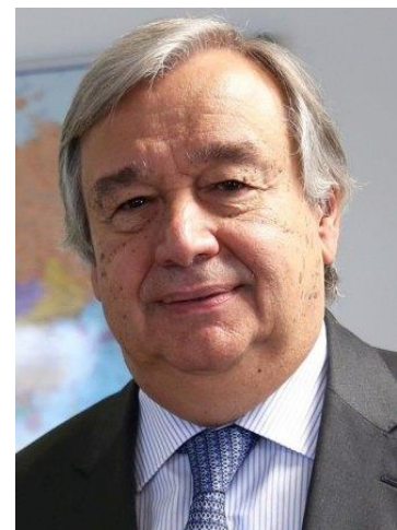
António Guterres

マイナスの影響はいまだに続いている。OCHAは12月27日、十分な食料を得られないハイチ国民は、2019年の370万人から、2020年には400万人超になりそうだとの見通しを示した。