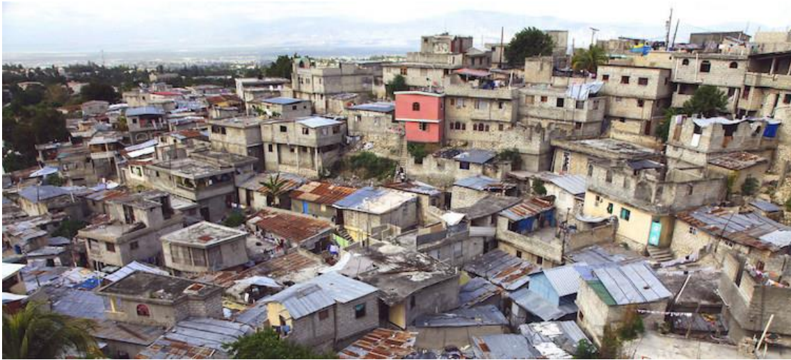
An informal settlement in Port-Au-Prince, Haiti.