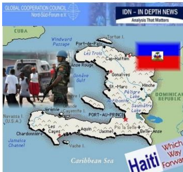
資料：Map of Haiti

同時に、治安の悪化と社会の緊張が高まり、援助関係者が大半の地域に足を踏みこめない状況にある。